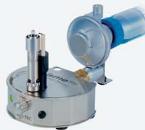
Adapter 360 / Adapter 360 für Kartuschen CV 360 for gas cartridges CV 360 Art.-Nr./Art.-No. 2.000.701