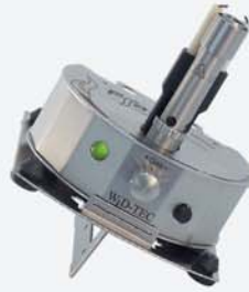
Neigungsverstellung / Tilt adjustment Edelstahl / stainless steel Art.-Nr./Art.-No. 2.000.300

Flame 100 - for a safe flame in the laboratory!